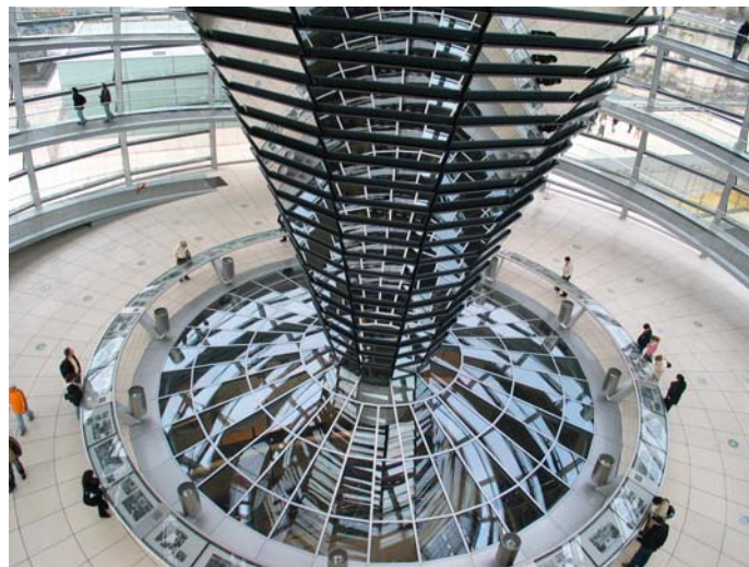
De koepel van de Reichstag - Sir Norman Foster