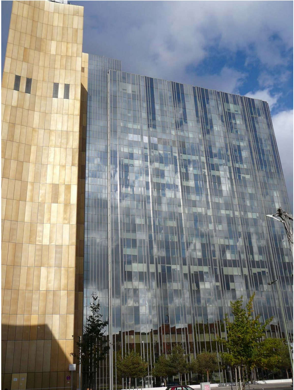
Axel Springer Verlag