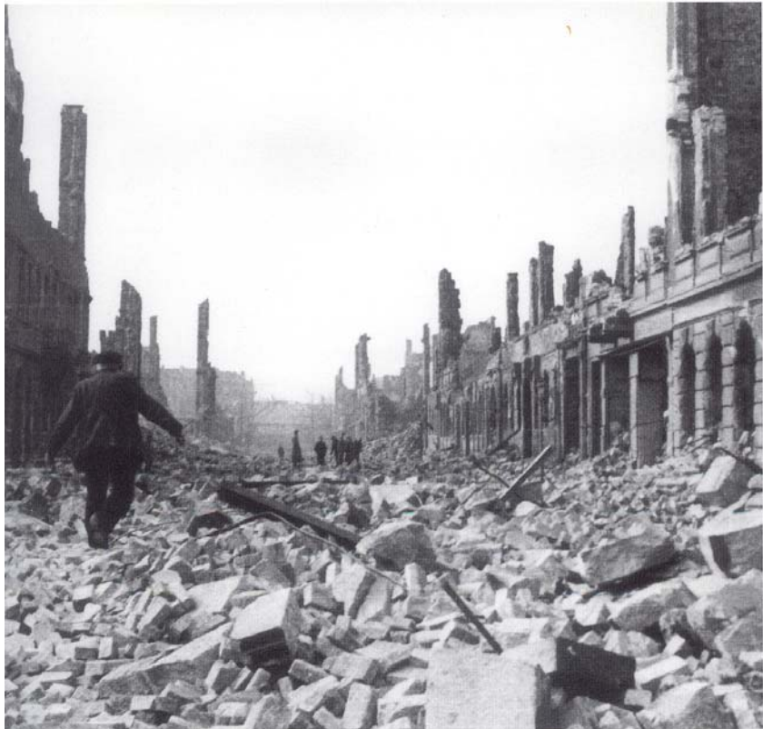
Eure Städte sind mit Feuer verbrannt (Jesaja 1)

De toren is zoals gezegd zeshoekig met een diameter van 12 meter en een hoogte van 53,5 meter. Bovenop de toren staat een 1,80 hoog verguld kruis op een vergulde kogel en met een wenteltrap komt men bij de klokkenkamer. Hier hangen zes bronzen klokken, vervaardigd door de firma Gebr. Rincker uit Sinn. De grote klok weegt 5.600 kg en draagt het opschrift: „Eure Städte sind mit Feuer verbrannt. Aber mein Heil bleibt ewig, und meine Gerechtigkeit wird kein Ende haben“. De kleinste klok weegt 1.400 kg en draagt het opschrift: „Seid fleißig zu halten die Einigkeit im Geist durch das Band des Friedens.“